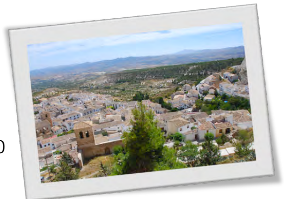
Vélez Blanco

María, Chirivel, Vélez Rubio y Vélez Blanco son los cuatro pueblos que aportan su término municipal a esta Sierra con un total de 10.200 habitantes.