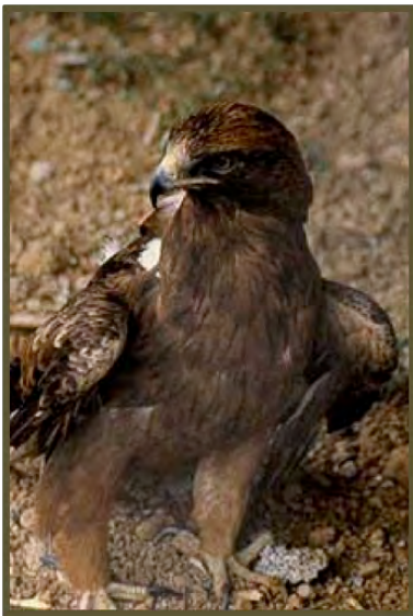
Imagen en Ventana del visitante bajo CC

Para que te hagas mejor una idea de su tamaño fíjate en la foto de la derecha.