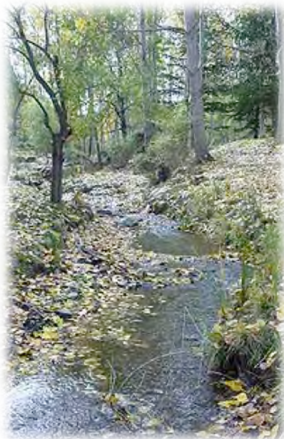
Imagen en ventana del visitante bajo CC