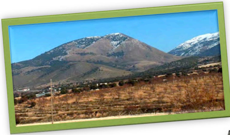
Imagen en Andalucía Rústica