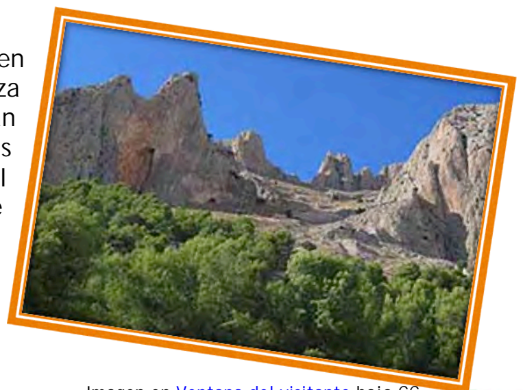
Imagen en Ventana del visitante bajo CC

Todas estas imágenes pertenecen a esta sierra, que se caracteriza por un paisaje donde se alternan hermosos valles con escarpadas sierras y que en la que en el invierno la nieve hace acto de presencia con frecuencia.