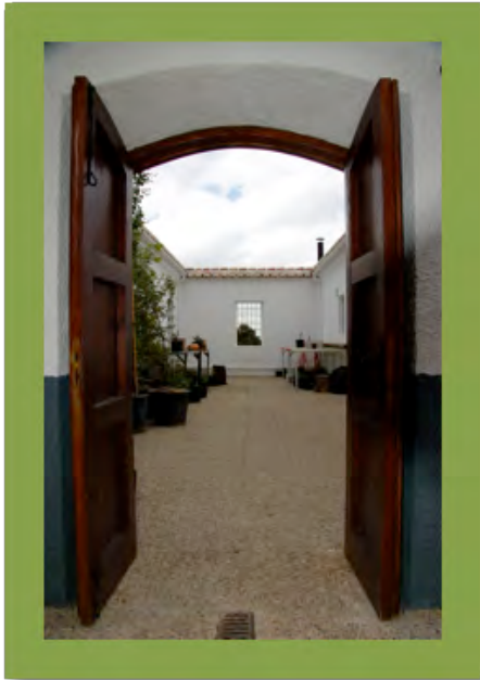
Jardín botánico Umbría de la Virgen.

Observa los impresionantes cambios del paisaje, en el que escarpados riscos y rocosas cumbres se alternan con barrancos y cárcavas; y todo ello salpicado de nuestro conocido bosque mediterráneo.