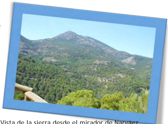
Vista de la sierra desde el mirador de Narváez, Imagen en ventana del visitante bajo CC