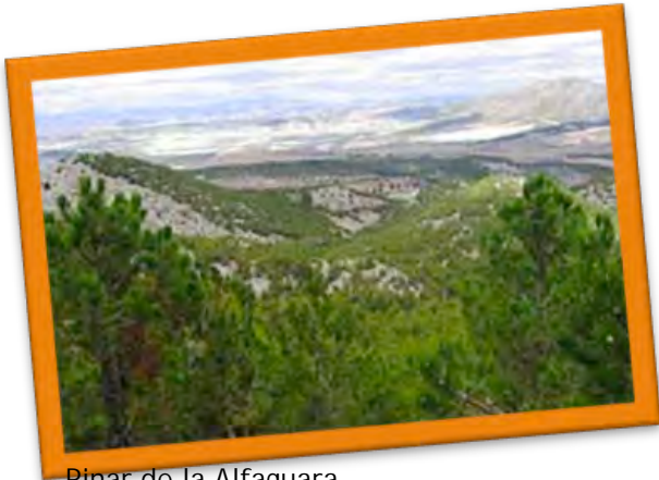
Pinar de la Alfaguara.

Sin embargo aquí tenemos Pinar de la Alfaguara el único monte mixto de pino carrasco y encina que nunca se taló ni roturó, llegando hasta nuestros días tal y como se conoce en la actualidad (salvo dos pequeños rodales reforestados por el hombre)