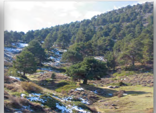
Prado del Rey Imagen en ventana del visitante bajo CC

Todas estas características hacen proporcionar al entorno una gran riqueza vegetal, veámosla.