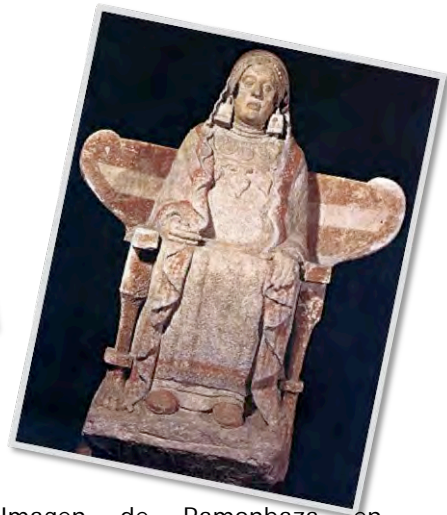
Imagen de Ramonbaza en wikimediacommons bajo CC

Plan educativo para el conocimiento y conservación del patrimonio cultural andaluz y su entorno natural