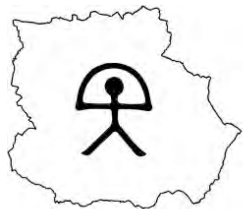
Imagen de Región del sureste en Flickr bajo CC

¿Sabes de dónde procede? Fíjate en la imagen de la siguiente página y busca algún parecido con el indalo.