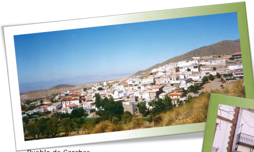
Pueblo de Carches.