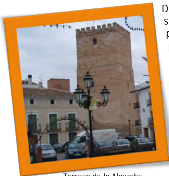
Torreón de la Alcazaba.

Dejando de lado la prehistoria, que será objeto de una reflexión posterior podemos decir que por Orce han pasado las principales culturas que han poblado con el paso de los siglos la Península Ibérica. Del periodo árabe se conserva la alcazaba árabe, que fue construida a comienzos del siglo XI. Fue siempre un territorio de frontera en el que las luchas con los cristianos se decantarán a favor de éstos en el año 1488, cuando Orce pase a manos de los Reyes Católicos. De la historia moderna de Orce podemos reseñar su importancia ganadera, llegando a ser uno de los principales centros de provisión lanera de Andalucía. Durante los primeros años del siglo XX Orce sufrió una fuerte emigración a América y durante la guerra civil, Orce perderá parte de su patrimonio cultural.