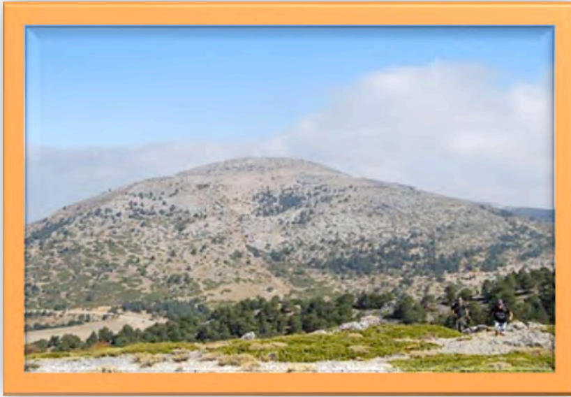
Pico de Santa Bárbara (2.270m)