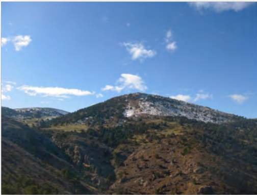
Mirador de las Bastidas Imagen en ventana del visitante bajo CC